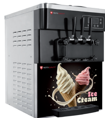
RQ1CM 830 Cube