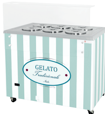
GELATO POZETTI 6 PASTEL BLUE