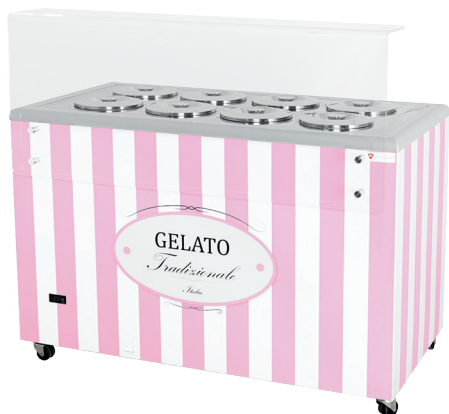
GELATO POZETTI 8 PINK