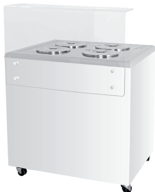
GELATO POZETTI 4