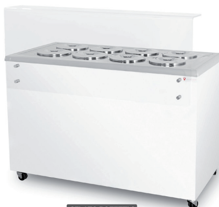
GELATO POZETTI 8

OKLEJENIE GELATO POZETTI 8 ZA 260 ZŁ NETTO Skontaktuj się z nami!